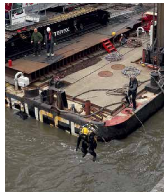
We zetten regelmatig duikers in voor de werken aan de historische kaaimuur.