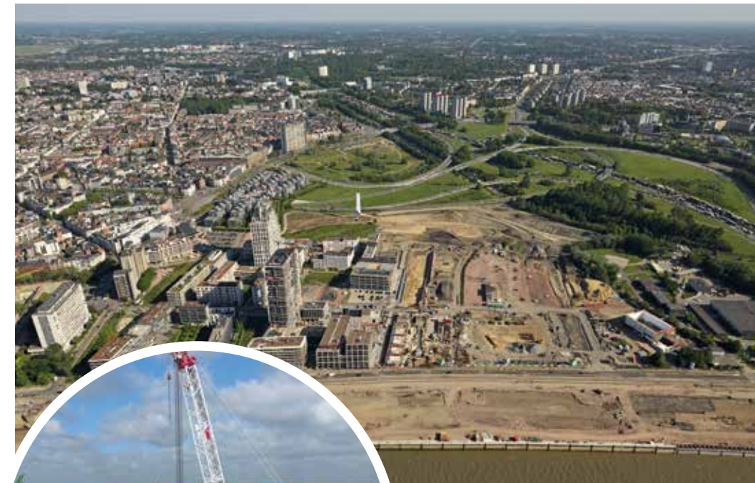
Ter hoogte van Nieuw Zuid hebben we de kaaimuur volledig vervangen.

Schrijf je dan in op de digitale nieuwsbrief van AG VESPA via www.onzekaaien.be .