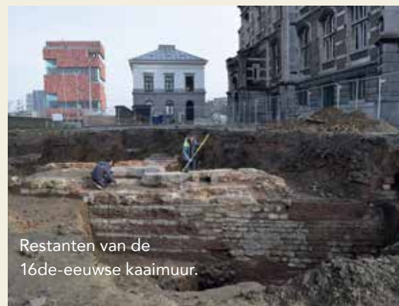
Restanten van de 16de-eeuwse kaaimuur.

We troffen ook de kaaimuur uit de Spaanse periode aan; in zeer goede staat voor een 16de-eeuws bouwwerk. Beide vondsten werden opgemeten en geïnventariseerd. De Spaanse kaaimuur zal bewaard blijven in de ondergrond. De Napoleontische kaaimuur konden we niet behouden omdat die in de weg lag van de werken.