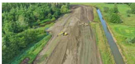
Het plan voor Vlassenbroek