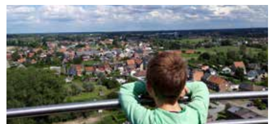
Wat beweegt er in Vlassenbroek?