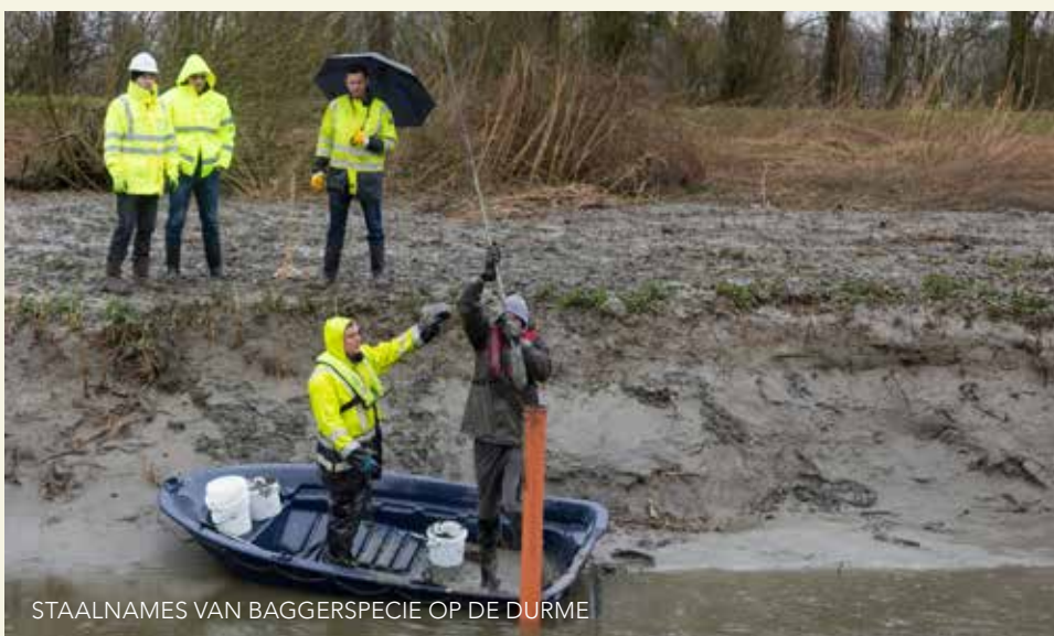
STAALNAMES VAN BAGGERSPECIE OP DE DURME

USAR, kort voor Using Sediment As a Resource, bundelt de expertise van vier organisaties uit België, Frankrijk, Nederland en het Verenigd Koninkrijk. Het doel: nuttige toepassingen vinden voor de baggerspecie die ontstaat bij het onderhoud van bevaarbare waterlopen en havens. Als waterwegbeheerder wordt De Vlaamse Waterweg nv geconfronteerd met grote hoeveelheden baggerspecie. Daarvoor wil het kostenefficiënte en duurzame oplossingen uitwerken.