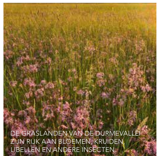
DE GRASLANDEN VAN DE DURMEVALLEI ZIJN RIJK AAN BLOEMEN, KRUIDEN, LIBELLEN EN ANDERE INSECTEN.