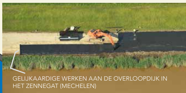
GELIJKAARDIGE WERKEN AAN DE OVERLOOPDIJK IN HET ZENNEGAT (MECHELEN)