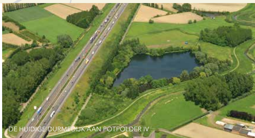
DE HUIDIGE DURMEDIJK AAN POTPOLDER IV

We leggen niet enkel een ringdijk en overloopdijk aan, maar nemen ook een ander stukje Durmedijk onder handen. Tussen de E17 en de overgang naar de ringdijk en overloopdijk verhogen we de dijk. Afhankelijk van de locatie zal hij tussen de 2 en de 4 meter hoger liggen dan het landschap. Deze dijk krijgt een halfverharde bekleding.